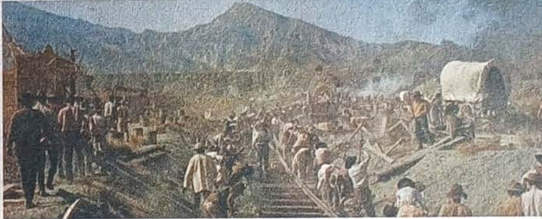
In alto, il treno in arrivo a Moneglia da Sestri e, a destra, da Deiva. Sotto, la vecchia stazione di Riva e il capolavoro di Sergio Leone "C'era una volta il West"

lerie per Moneglia: sei chilometri di buio rotto appena da brevi squarci di luce a picco sulla scogliera e poi ancora buio, e finalmente Moneglia, come un miracolo, poi sempre gallerie, e i paesi tut-