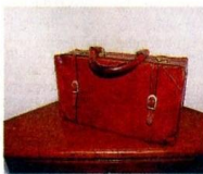
La borsa del dottore

REPERIBILITÀ Partiva per qualunque telefonata, in qualunque giorno, a qualunque ora