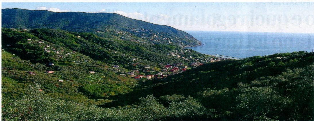
Una spettacolare veduta di Moneglia. Il medico condotto doveva raggiungere ogni casa nel minor tempo possibile: prima arrivava in Lambretta, poi con l'utilitaria